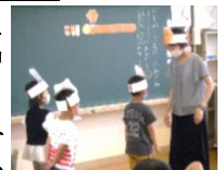
7月道徳授業参観より

身の回りの人権問題に気づき、人権に対する正しい理解、当事者意識、差別や人権侵害を許さない態度等を身に付け、行動できるよう、人権について考える授業を行っていきます。