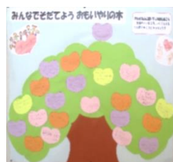
昨年度の「人権の木」より

優しい言葉、うれしかった行為、すてきな姿…。ハート型の実にそれを書き、『人権の木を、思いやりの気持ちでいっぱいにして!』という取組です。書かれた子も、書いている子も、心がポカポカ、輝きキラキラ。うれしい気持ちで、ニコニコ笑顔がいっぱいになあれ!!